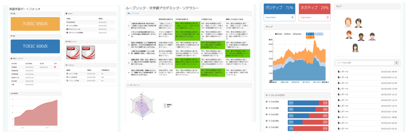
ためて整理する学生ポートフォリオ画面